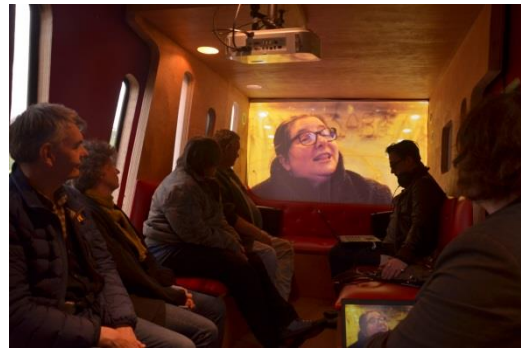
Intérieur du MKN Van

Pour Echelle Inconnue, il s'agit de ne pas imposer les modes d'habitat dominants mais de respecter la dignité des habitats nomades choisis (temporaires, auto-construits...) en donnant accès à des ressources permettant de les développer . Le droit au logement est de fait relié aux droits humains fondamentaux puisque ceux-ci font système et sont interdépendants.