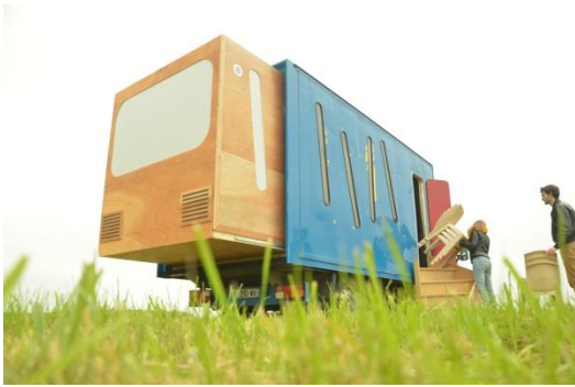
Extérieur du MKN Van