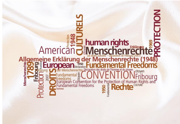
Illustration extraite du site https://droitsculturels.org/definir-les-droits-culturels/

groupe de personnes qui partagent des références constitutives d'une identité culturelle commune, qu'elles entendent préserver et développer » 119 . L' identité culturelle est l' objet commun des droits culturels , elle est au cœur des libertés du sujet . « L'expression "identité culturelle" est composée de l'ensemble des références culturelles par lequel une personne, seule ou en commun, se définit, se construit, communique et entend être reconnue dans sa dignité. » 120