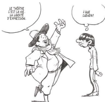
Illustration présentée dans le guide du Collectif des réseaux Insertion Culture (lire bibliographie)